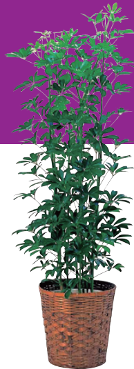
カポック(8号・10号鉢) 販売価格(税別) 【8号】¥10,000 【10号】¥15,000