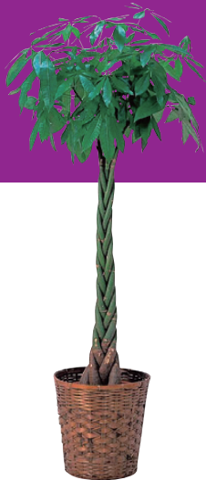
パキラ(8号・10号鉢) 販売価格(税別) 【8号】¥10,000 【10号】¥15,000