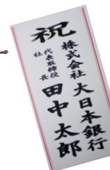
紙札 メッセージカード 無料