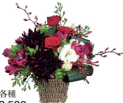
アレンジ各種 販売価格(税別) ¥3,500~