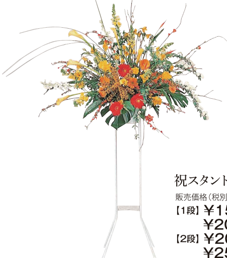
祝スタンド花(1段・2段) 販売価格(税別) 【1段】¥15,000 ¥20,000 【2段】¥20,000 ¥25,000 ¥30,000 サイズ: 1段/約H190/W100