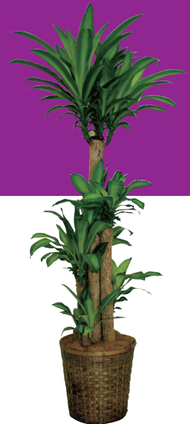
幸福の木(8号・10号鉢) 販売価格(税別) 【8号】¥10,000 【10号】¥15,000