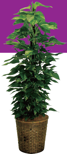
ポトス(8号・10号鉢) 販売価格(税別) 【8号】¥10,000 【10号】¥15,000