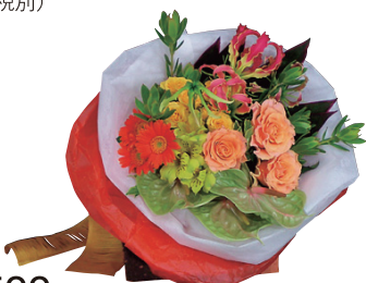
花束各種 販売価格(税別) ¥3,500~